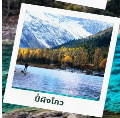
ปี่ผิงโกว