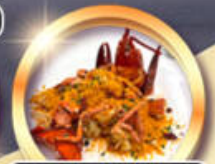
ซิวัดกึ่งมิงท