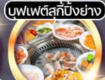
บัพเพตส์กึ่งปิ้งย่าง