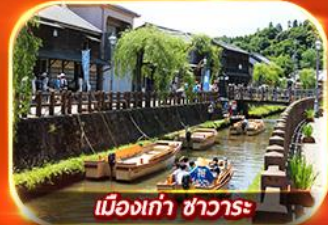
เมืองเก่า ซาวาระ