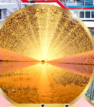
นาคานะ โนะ ซาโตะ