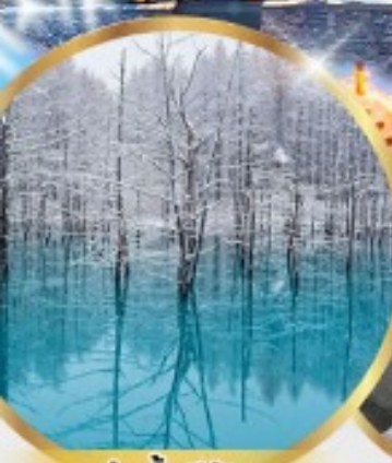
บ่อน้ำสึฟุ