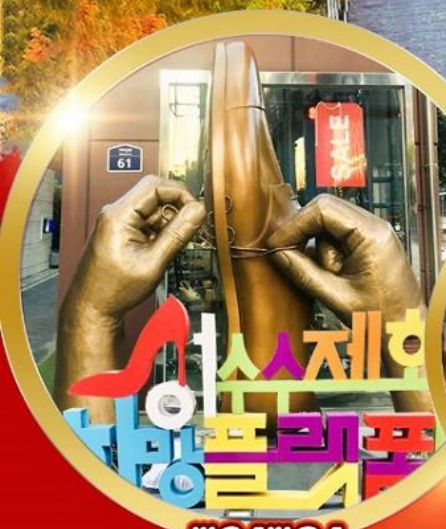
ซองซูคอง วอร์ดกึงสตรีท