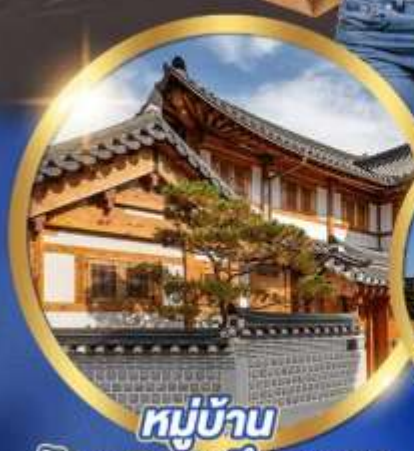
หมู่บ้าน

• ซุปป์องแควอ์คังสตรีท • ซุปป์ตลาดเมียงดง