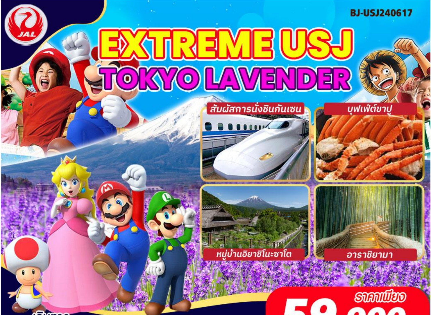
สัมผัสนั่งชินกันเซน