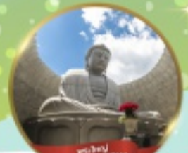
พระใหญ่ HILL OF BUDDHA