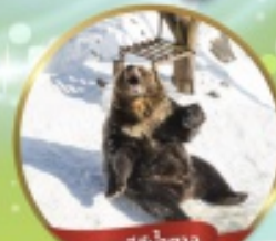
ฟาร์มหมีสึน้ำตาล