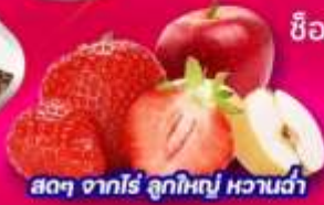
สดๆ จากไร่ ลูกใหญ่ หวานฉ่ำ

เล่นสกีที่ลานสกี • สนุกสนานกับการตกปลาน้ำแข็ง • ซิมปลาเทราส์แล่สด ขอฟรที่วัดพงอินชา • คลองกฤษแจ N Tower • เล่นเครื่องเล่นที่สวนสนุกเอเวอร์แลนด์ ชมคลองชองเกซอน • Coex mall • ห้องสมุดสุดชิค Starfield Library ช้อปปิงตลาดเมียงดง • ตลาดซองแด • ย่านยอนนัมดง • Hyundai shopping outlet