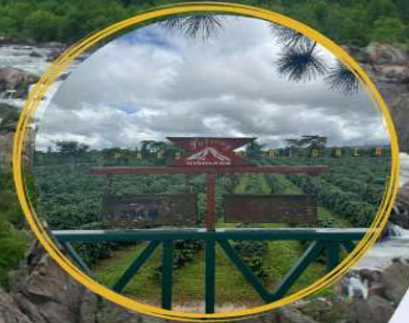
ไร่กาแฟโบลาวเอน