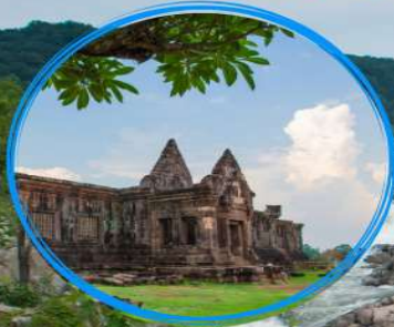
ปราสาทวัดพู