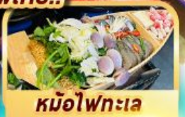
หม้อไฟทะเล