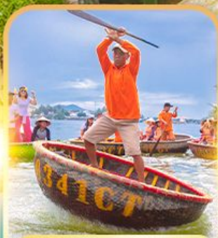
เรือกระด้ง