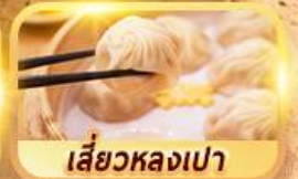
เสี่ยวหลงเปา