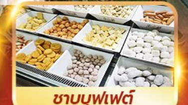
ชาบูบุฟเฟ่ต์