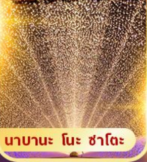
นาบาระ โนะ ซาโตะ