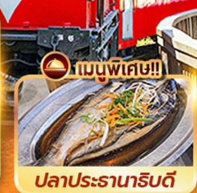
เมนูพิเศษ!!