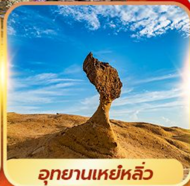
อุทยานเหยหลิว