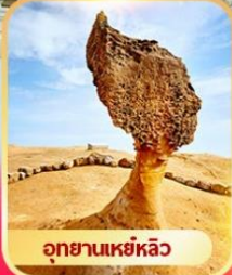
อุทยานเหยี่ยวหลิว