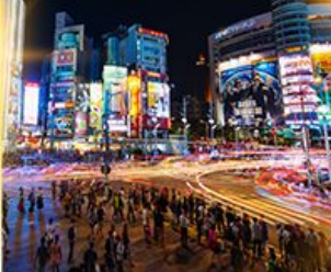
ซีเหมินติง