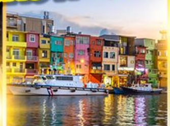
หมู่บ้านประมงเจินปิง