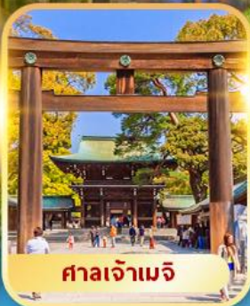
ศาลเจ้าเมจิ