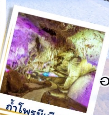
ถ้ำไฟรมีเทียส