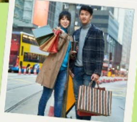
Free time Shopping