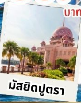
มัยสิริบุตรา