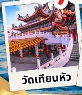
วัดเทียนหัว