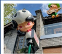
ถนนคนเดินซอยกว้างแคน