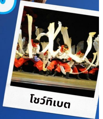
โชว์ทิเบต