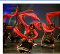
โชว์ทิเบต