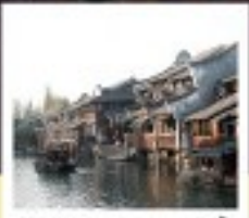
เมืองโบราณผานหลงกู่เจิน