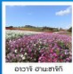
ฮาวาย ฮานาฮานา