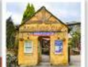
ยูฟุอิน ฟลอร์รัล