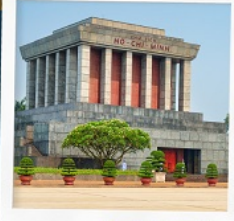
สุสานโฮจิมินห์