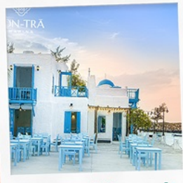
ซานตารีน้ำกาแฟ