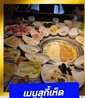
เมนูสุกที่เค็ด