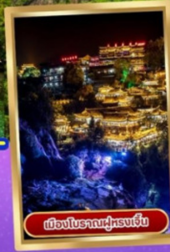
เมืองโบราณผู่หลงเจิ้น