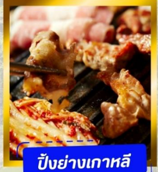
ปิ้งย่างเกาหลี