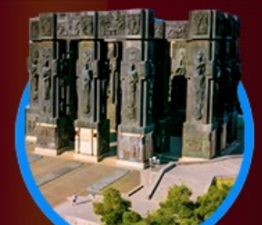
อนุสาวรีย์ประวัติศาสตร์