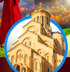
โบสถ์กรินดี เมืองทบิลีซี