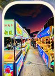
ตลาดอ้อหึง