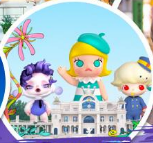
ซื้อบิง POP MART