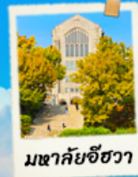
มหาวิทยาลัยฮวา