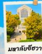
มหาชัยชีวา