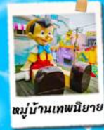
หมู่บ้านเทพนิยาย