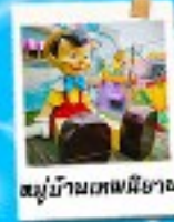
หมู่บ้านเทพนิยาย