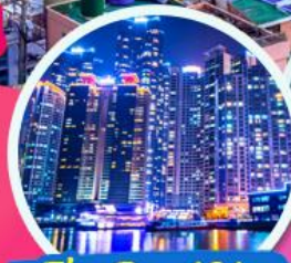
The Bay 101