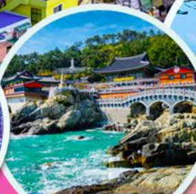
วัดแฮดง ยงกุงซา