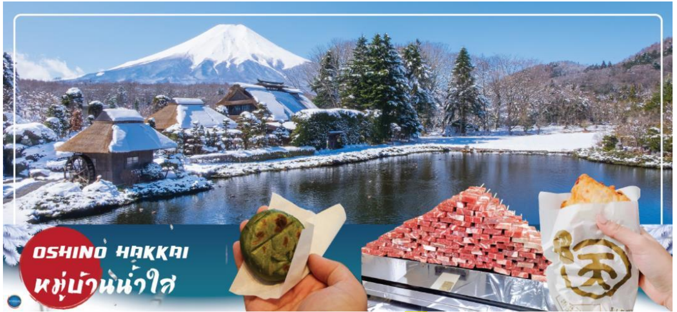
OSHINO HAKKAI หมู่บ้านน้ำใส