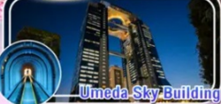
Umeda Sky Building