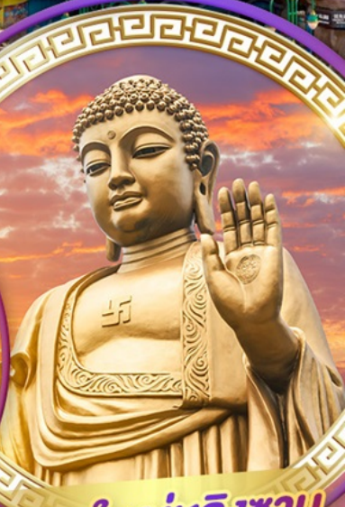
พระใหญ่หลิงซาน

สักการะพระใหญ่หลิงซานต้าฟอ ถ่ายรูปคู่กันดื่มยักษ์ ชมสุดยอดพุทธศิลป์ร่วมสมัยของจีน "ศาลาฟานกง"