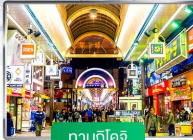
ทานุกิโคจิ