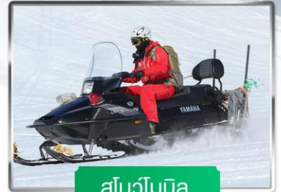
สโนว์โมบิล