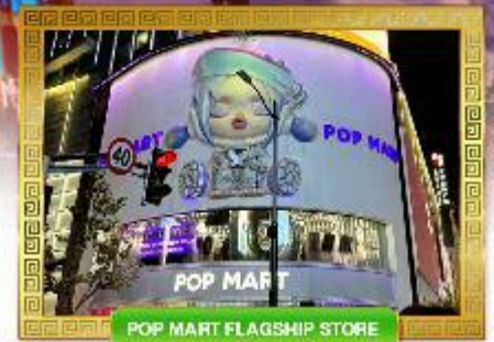
POP MART FLAGSHIP STORE