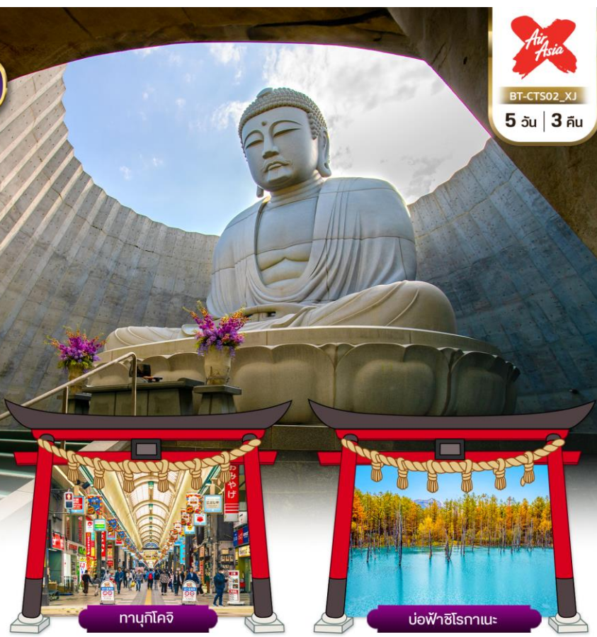
ทานุกิโคจิ