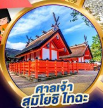
ศาลเจ้า สุมิโยชิ ไทอะ