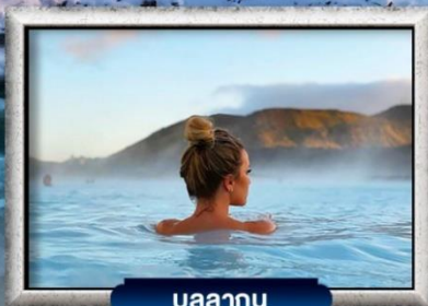
บลูลากูน