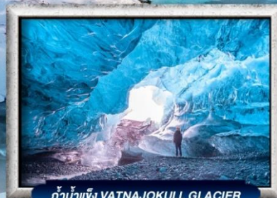
ถ้ำน้ำแข็ง VATNAJOKULL GLACIER

บินธุรกิจ Full Service | พิเศษ! ทานอาหารโดมกระจกิว 360 องศา