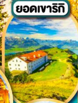
ยอดเขารีกี