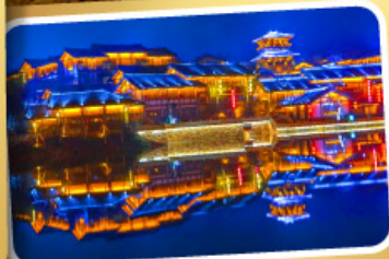
Oriental Salt Lake City