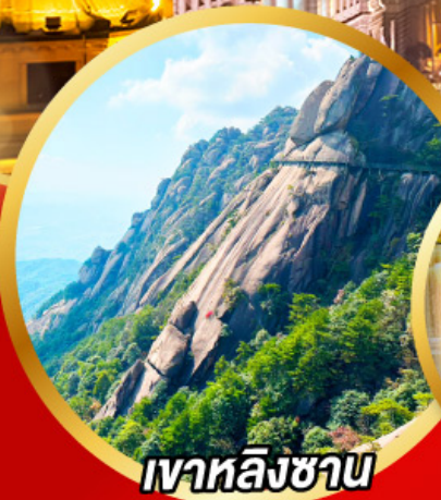
เวาหลิงซาน