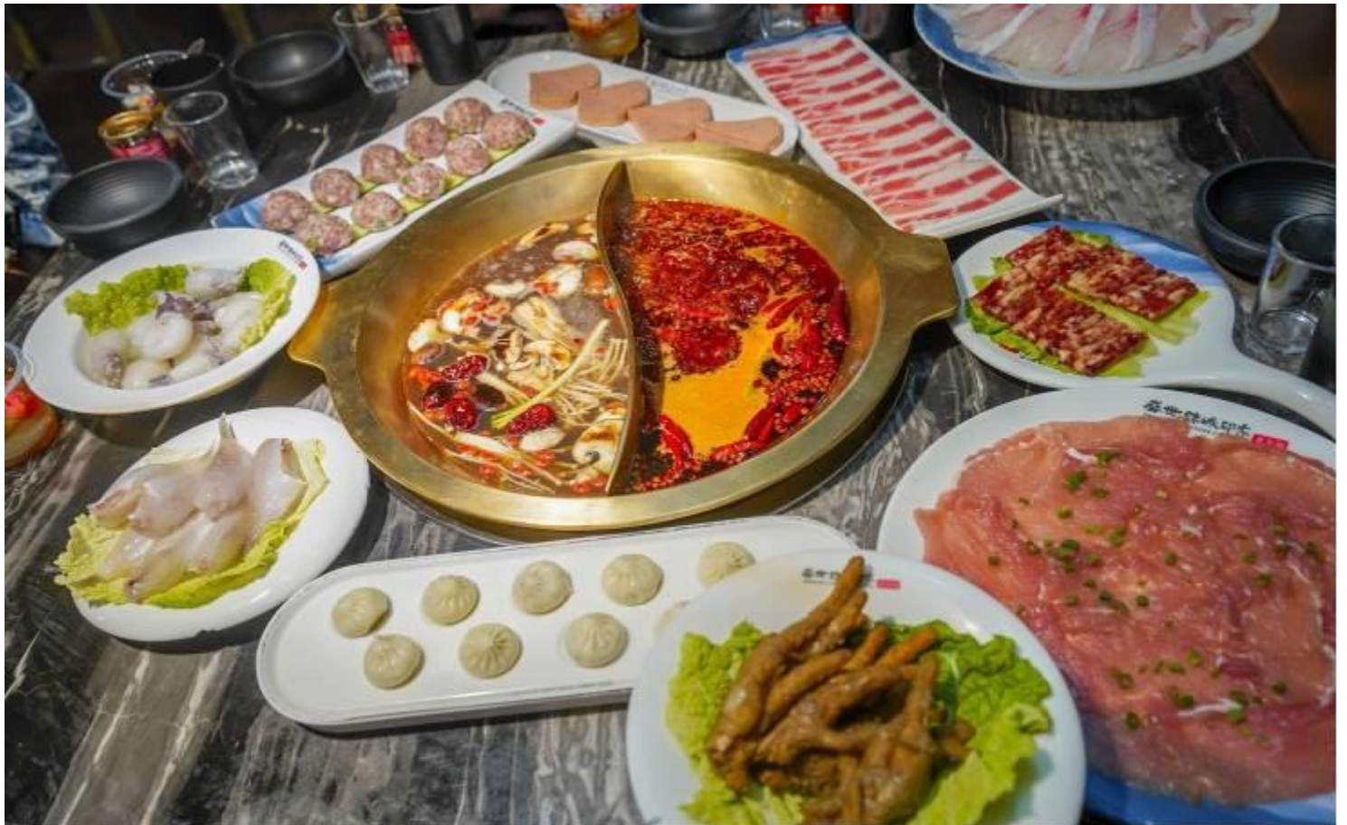
GO1TFU-MU112 เฝิงตู หวงหลง จิวจ้ายโกว ดูหมี่แพนต้า 6วัน 5คืน โดยสายการบิน China Eastern (MU)