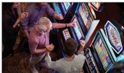
Vegas Style Casino