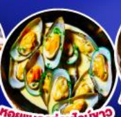
หอยแมลงภู่นิวอิงแลนด์