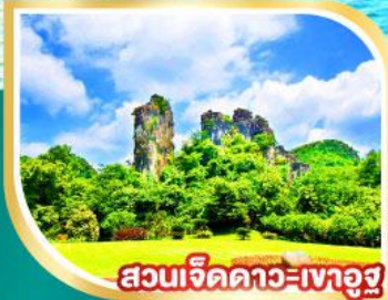
สวนเจ็ดดาว-เกาอูซู